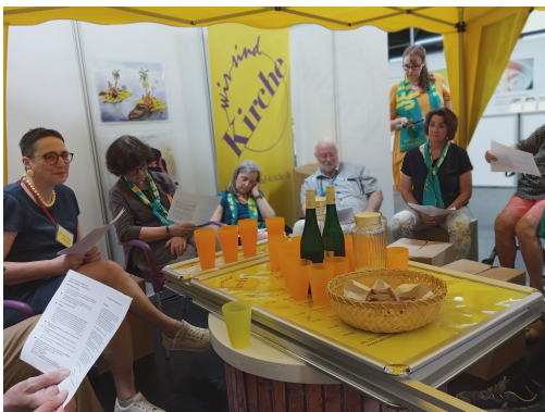
mit einfachen Mitteln vorbereitet von Sigrid Grabmeier