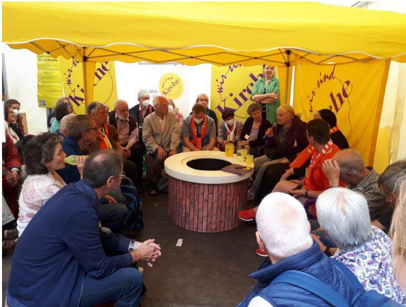
Gespräche rund um den "Jakobsbrunnen"