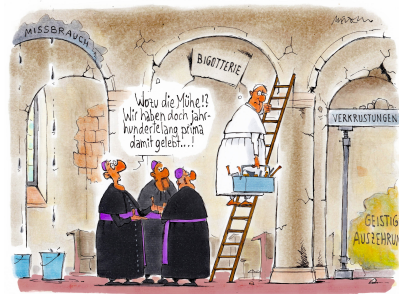
Renovierungsbedarf im Hause Gottes