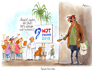
Opium fürs Volk