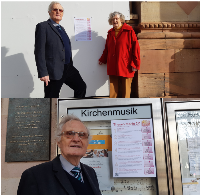
Dom zu Speyer