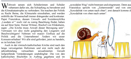
Konkret: © Gerhard Meier

Der „synodale Weg“ muss sehr bald zu konkreten und verbindlichen Beschlüssen führen, die auch Relevanz für die Weltkirche haben können. Denn die ganze römisch-katholische Weltkirche befindet sich in einer existenziellen Krise, die vom Missbrauchsskandal nicht ausgelöst ist, darin aber ihren Brennpunkt findet. Wenn nach dem KirchenVolksBegehren 1995 in Österreich die darin genannten Reformpunkte von der Kirchenleitung entgegengenommen und angegangen worden wären, wäre zumindest in den vergangenen 24 Jahren vielen Betroffenen großes Leid und der Kirche immenser Schaden an Glaubwürdigkeit erspart worden. Das Selbstbild der Kirche steht in Frage. Um die Grundfrage anzugehen, welche Relevanz das Christentum überhaupt (noch) hat in Staat und Gesellschaft, ist ein grundlegender Wandel in Lehre und Struktur, in Theologie und Pastoral dringend vorzuziehen.