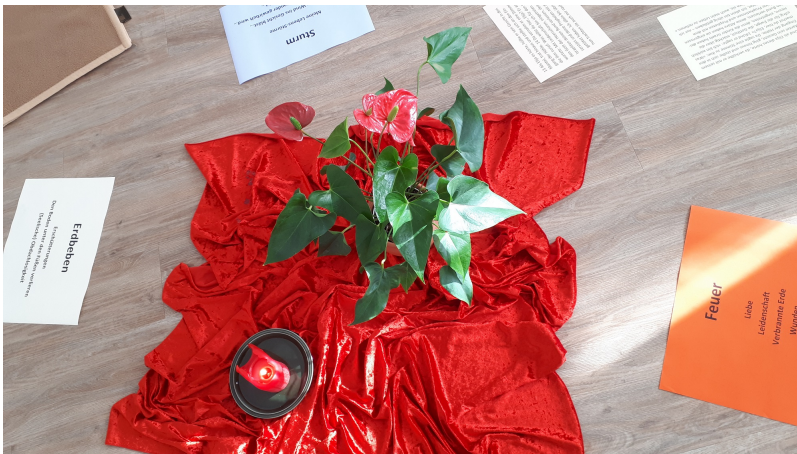
Bibliolog: Gott ist nicht im Sturm, nicht im Erdbeben, nicht im Feuer