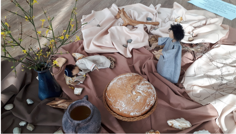
Bibliolog: Der Engel kommt zu Elija, der erschöpft unter einem Wacholderstrauch liegt