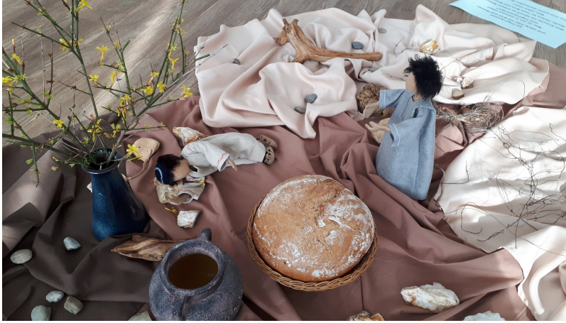
Bibliolog: Der Engel kommt zu Elija, der erschöpft unter einem Wacholderstrauch liegt