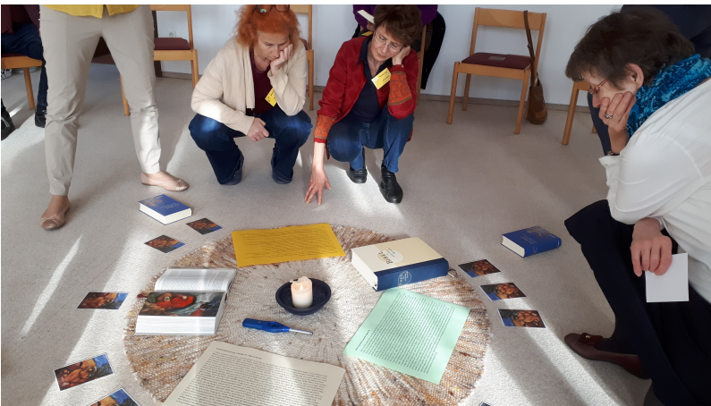
Was sagt die Bibelstelle jedem und jeder Einzelnen?