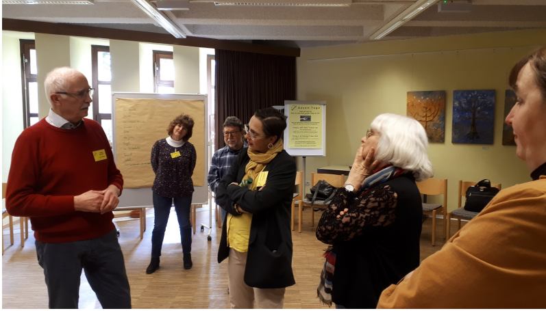
Bibliodrama "Steh auf, nimm deine Bahre und geh!" (Joh 5,8)