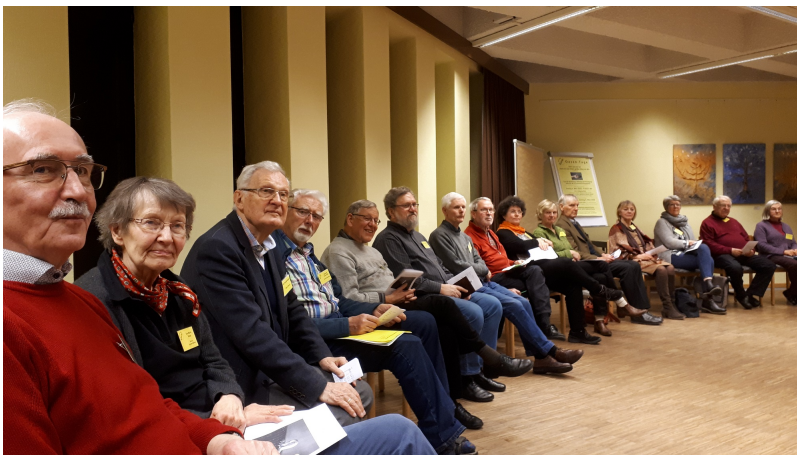
Trotz Corona-Virus waren mehr als 50 Frauen und Männer zu diesen ersten Wir sind Kirche-Oasen-Tagen gekommen