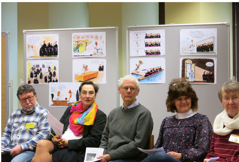
Mit dabei die fantastischen Franziskus-Karikaturen von Gerhard Mester