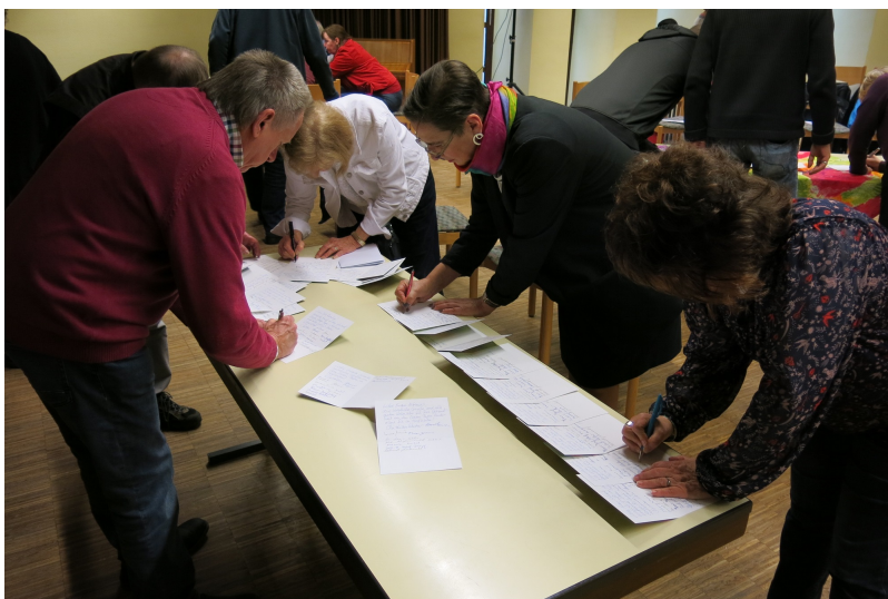
Grüße an diejenigen, die nicht dabei sein konnten