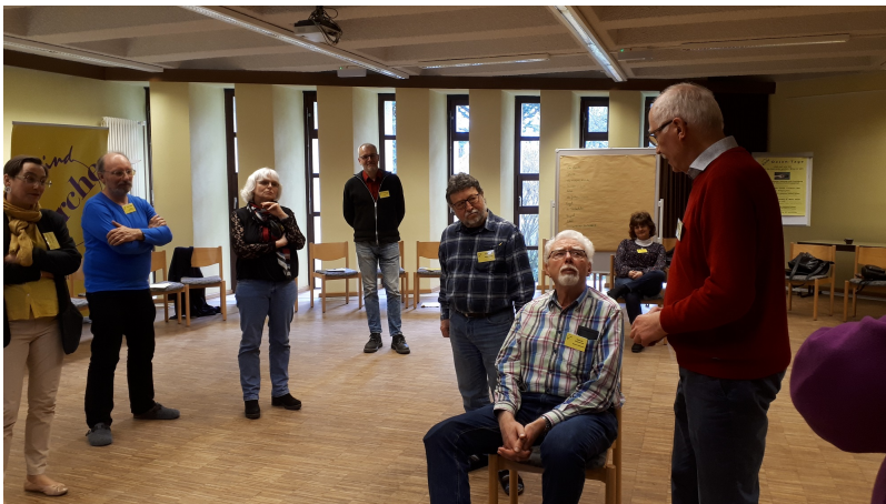
Bibliodrama: Wer hilft mir, an den Ort der Heilung zu gelangen?