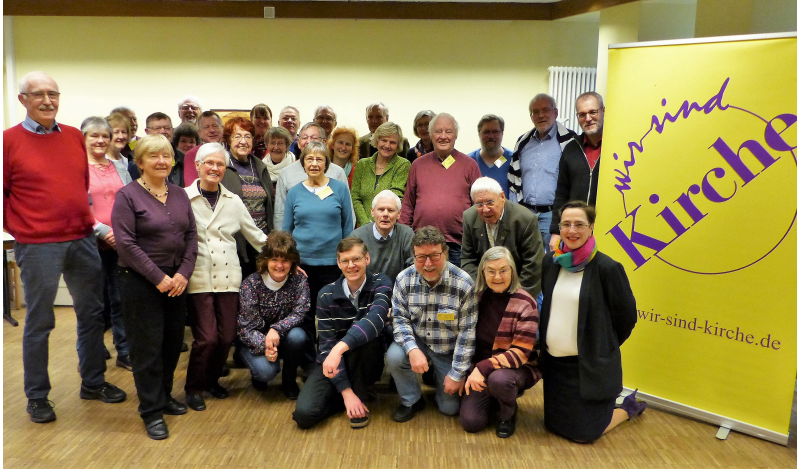
Abschiedsfoto nach dem Gottesdienst mit denen, die bis zum Ende bleiben konnten.