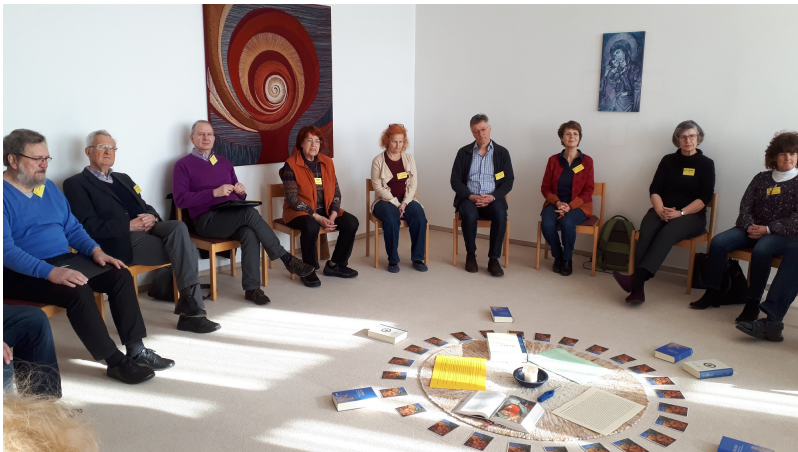
Bibliolog „Steh auf und iss, sonst ist der Weg zu weit für dich.“ (1 Kön 19)