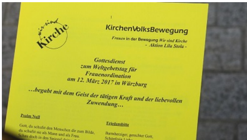
Liedzettel für den Gottesdienst