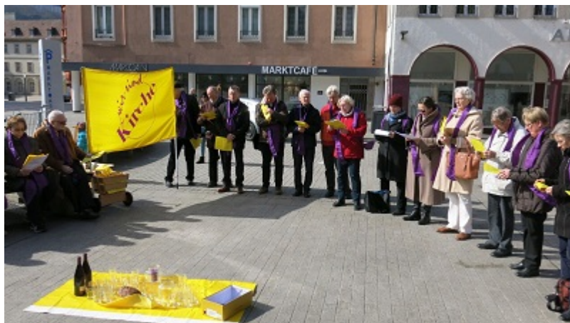
Gottesdienst zum Weltgebetstag für Frauenordination