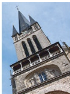
Ein „Weiter so“ gibt es in der Kirche in Deutschland nicht mehr. Steigende Prie-sterzahlen bringen alte Gewohnheiten des kirchlichen Lebens ins Wanken (im Bild der Aachener Dore).