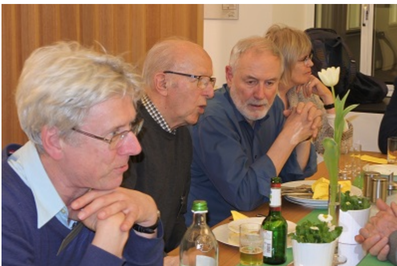
Auch die Pausen bieten Gelegenheit zu vielfältigen Kontakten