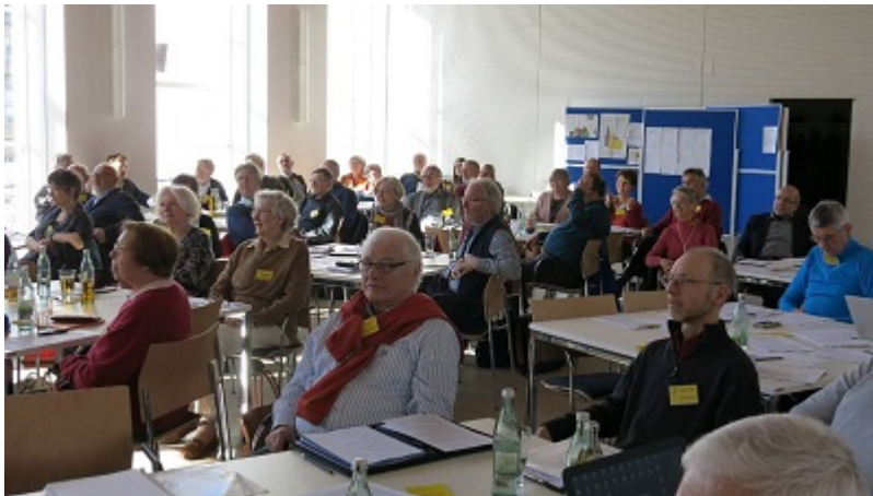
Plenumsitzung im historischen und sehr schön modernisierten Kardinal-Döpfner-Saal