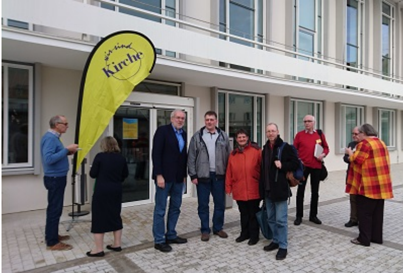
Vor dem sehr gastfreundlichen Burkardushaus, das auch ein wichtiger Ort bei der Würzburger Synode 1972-1975 war