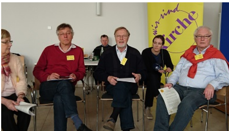
Austausch in vier parallelen Workshops, mit dabei die Redakteurin des Bayerischen Fernsehens