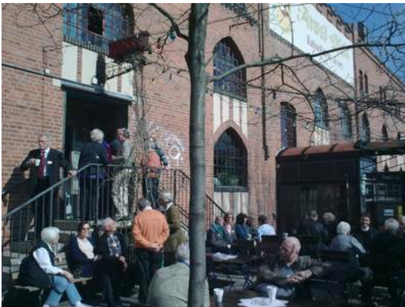
Pausengespräche im Tagungsort "KulturFabrik Hildesheim", in der Wir sind Kirche schon 1996 den KirchenVolksTag mit Gaillot gefeiert hat.